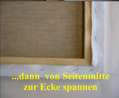
...dann von Seitenmitte zur Ecke spannen