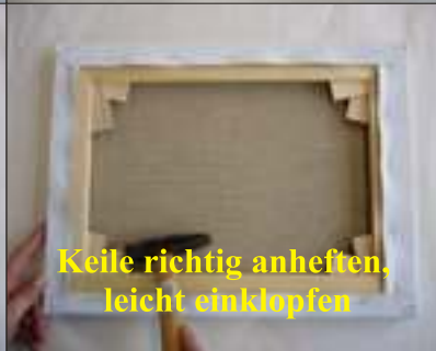
Keile richtig anheften, leicht einklopfen