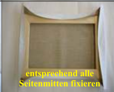
entsprechend alle Seitenmitten fixieren