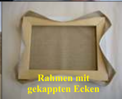
Rahmen mit gekappten Ecken