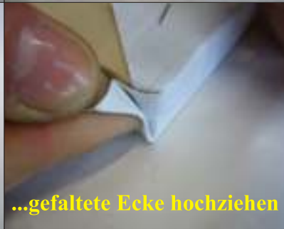
...gefaltete Ecke hochziehen