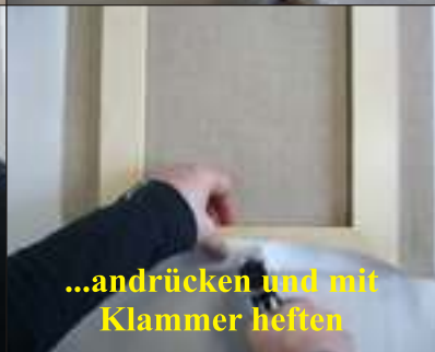
...andrücken und mit Klammer heften