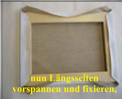
nun Längsseiten vorspannen und fixieren,