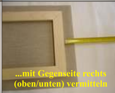
...mit Gegenseite rechts (oben/unten) vermitteln