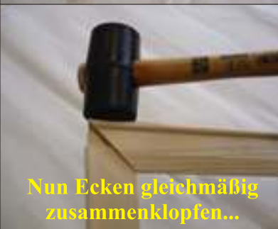
Nun Ecken gleichmäßig zusammenklopfen...