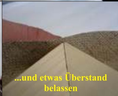
...und etwas Überstand belassen