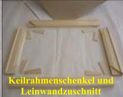
Keilrahmenschenkel und Leinwandzuschnitt