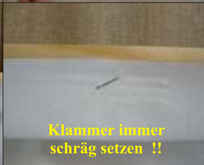
Klammer immer schräg setzen !!