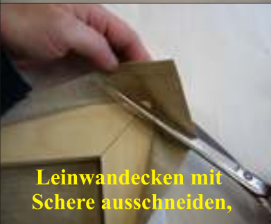
Leinwandecken mit Schere ausschneiden,