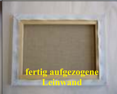
fertig aufgezugene Leinwand