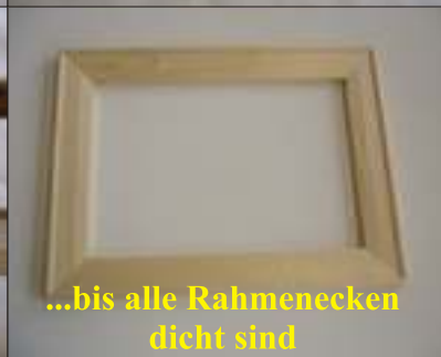
...bis alle Rahmenecken dicht sind