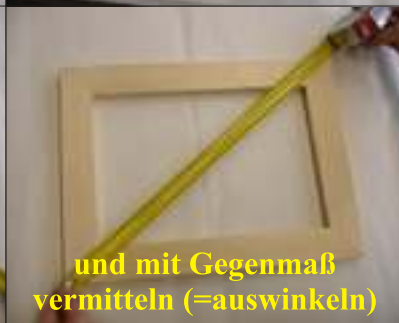
und mit Gegenmaß vermitteln (=auswinkeln)