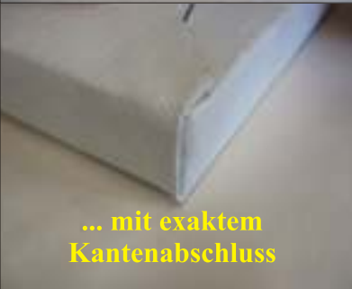
... mit exaktem Kantenabschluss