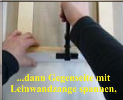
...dann Gegenseite mit Leinwandzange spannen,