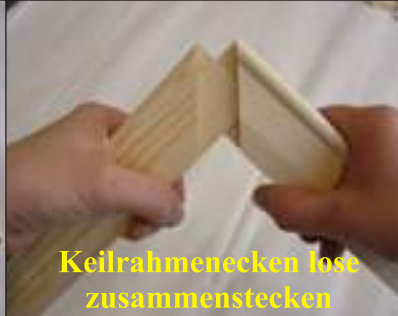
Keilrahmenecken lose zusammenstecken