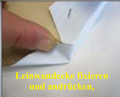
Leinwanddecke fixieren und andrücken,